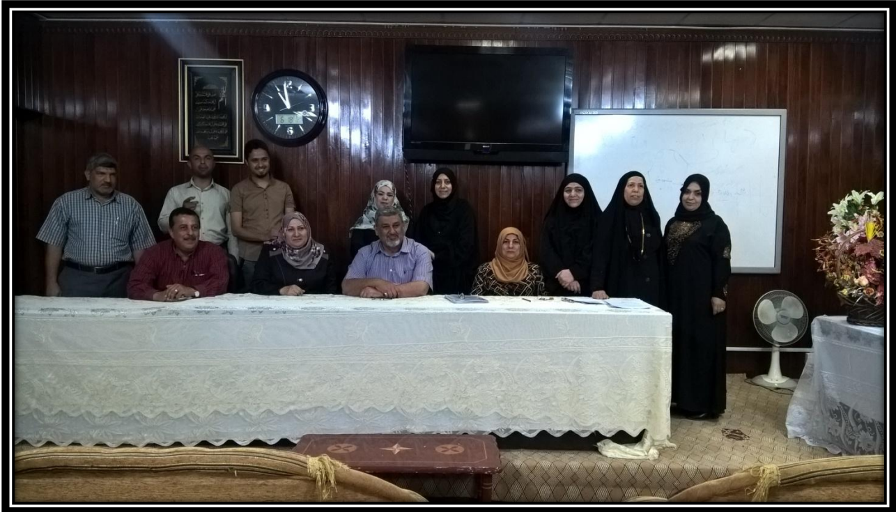
(( في ختام الدورة نخبة من الأساتذة المحاضرين مع عدد من المرشدين التربويين المشاركين في الدورة يوم الخميس الموافق ٢٠ / ٤ / ٢٠١٧ ))