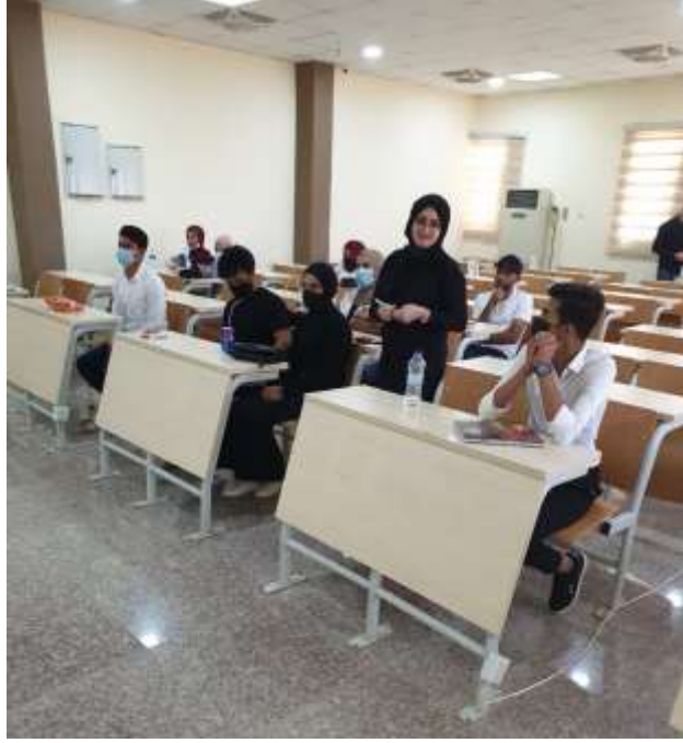
صور للطلبة في قاعة رقم ١٠ في كلية علوم الحاسوب وتكنولوجيا المعلومات .